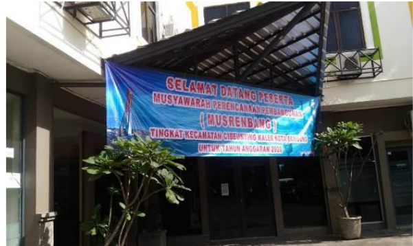
Gambar 7. Pendampingan Prodi Teknik Arsitektur pada Acara Musrenbang 2020

Hingga saat ini kegiatan diskusi antara Prodi Teknik Arsitektur dengan warga dan aparat RT dan RW masih dilakukan. Kegiatan diskusi ini dilakukan untuk merumuskan kembali besaran anggaran dana yang dibutuhkan untuk pembangunan Taman, karena pada akhirnya sumber dana didapat dari penggalangan dana warganya. Begitu pula dengan nama taman yang akan diberikan untuk taman ini masih berubah berdasarkan banyak usulan dari warga.