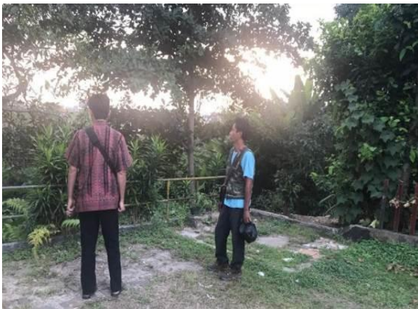
Gambar 1. Mahasiswa, Dosen, dan Aparatur Warga melakukan Survei Lapangan.