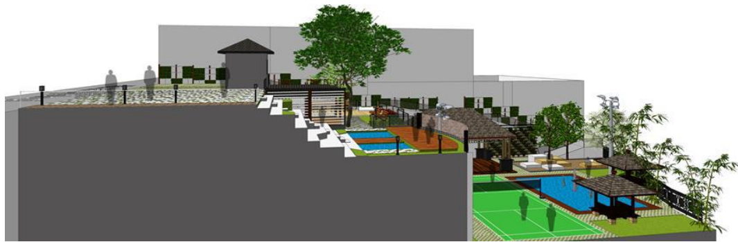
Gambar 5. Fasilitas Taman Sehat