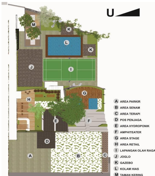
Gambar 6. Siteplan Taman Sehat

Gambar 5 dan 6 menunjukkan beberapa fasilitas yang ada di Taman Sehat, diantaranya :