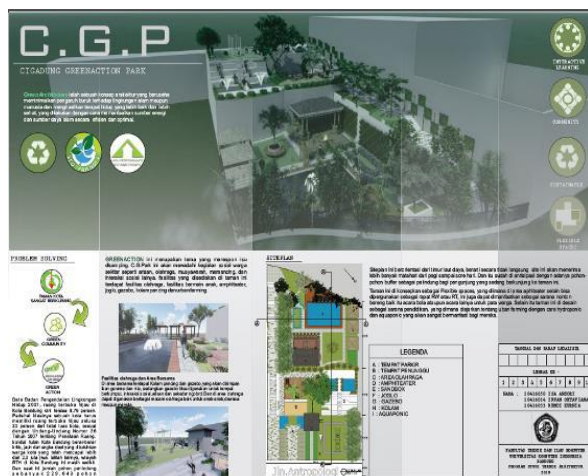
Gambar 3. Karya Perancangan Taman Terbaik Kedua Mahasiswa Prodi Teknik Arsitektur.