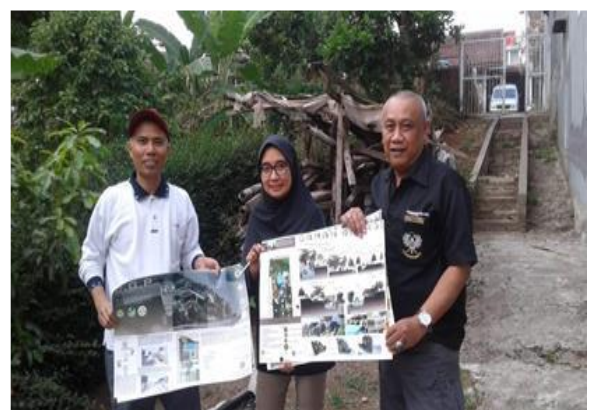
Gambar 4. Presentasi Hasil Karya Terbaik Mahasiswa Prodi Teknik Arsitektur